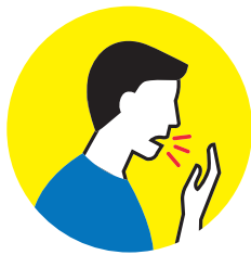
Husten oder Kurzatmigkeit