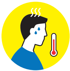
Fieber oder Schüttelfrost

Willkommen beim WIESELBURGER VOLKSFEST! Bitte beachten Sie unsere Coronavirus-Schutzempfehlungen. Wenn Sie eines der folgenden Symptome entwickeln melden Sie sich umgehend bzw. noch VOR Besuch der Veranstaltung in der Messeleitung oder an den Kassen.